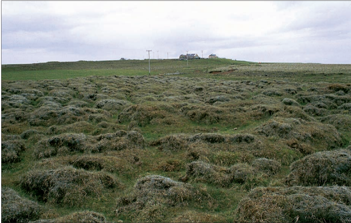
Horft til austurs yfir rústavæðið. Bæjarhóll Önundarholts er í baksýn.

eru að jafnaði um 10 cm þykkir og 10 - 20 cm langir. Brunnurinn breiðkar neðst og er þar um 70 cm breiður.