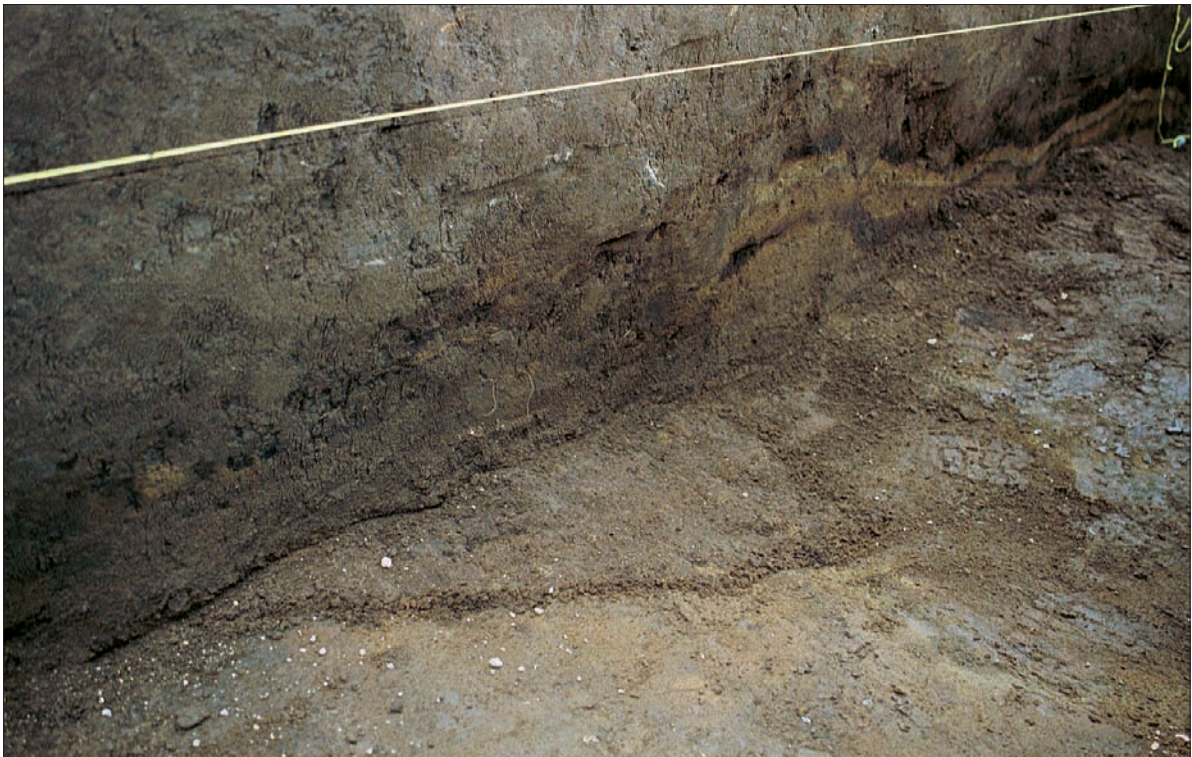
Gröf II. Í skurðbotni mótar fyrir norðvesturhorni grafarinnar. Í skurðbakkanum sést hvernig gröfin hefur farið gegnum 50 cm þykk mannvistarlæg og niður í óhreyfða ljósa mold. Svörtu gjóskulögin eru forsöguleg.