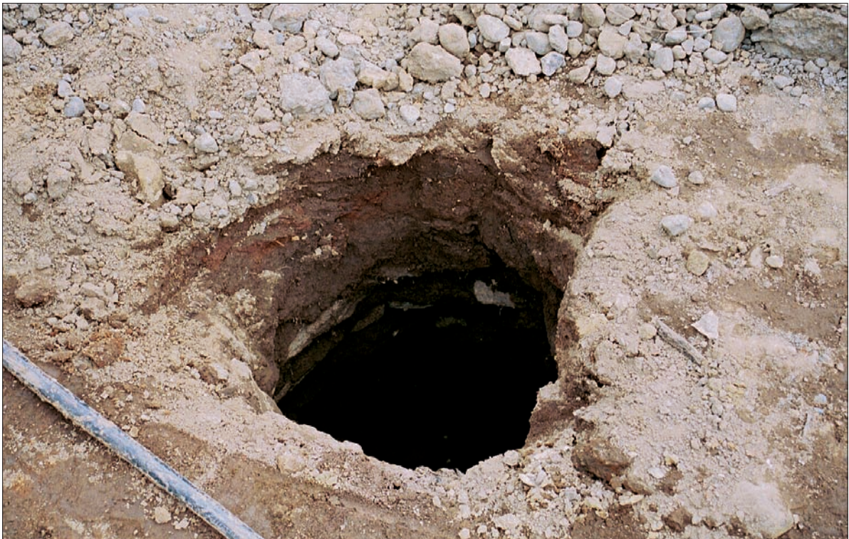
Horft ofan í brunninn á hlaðinu.