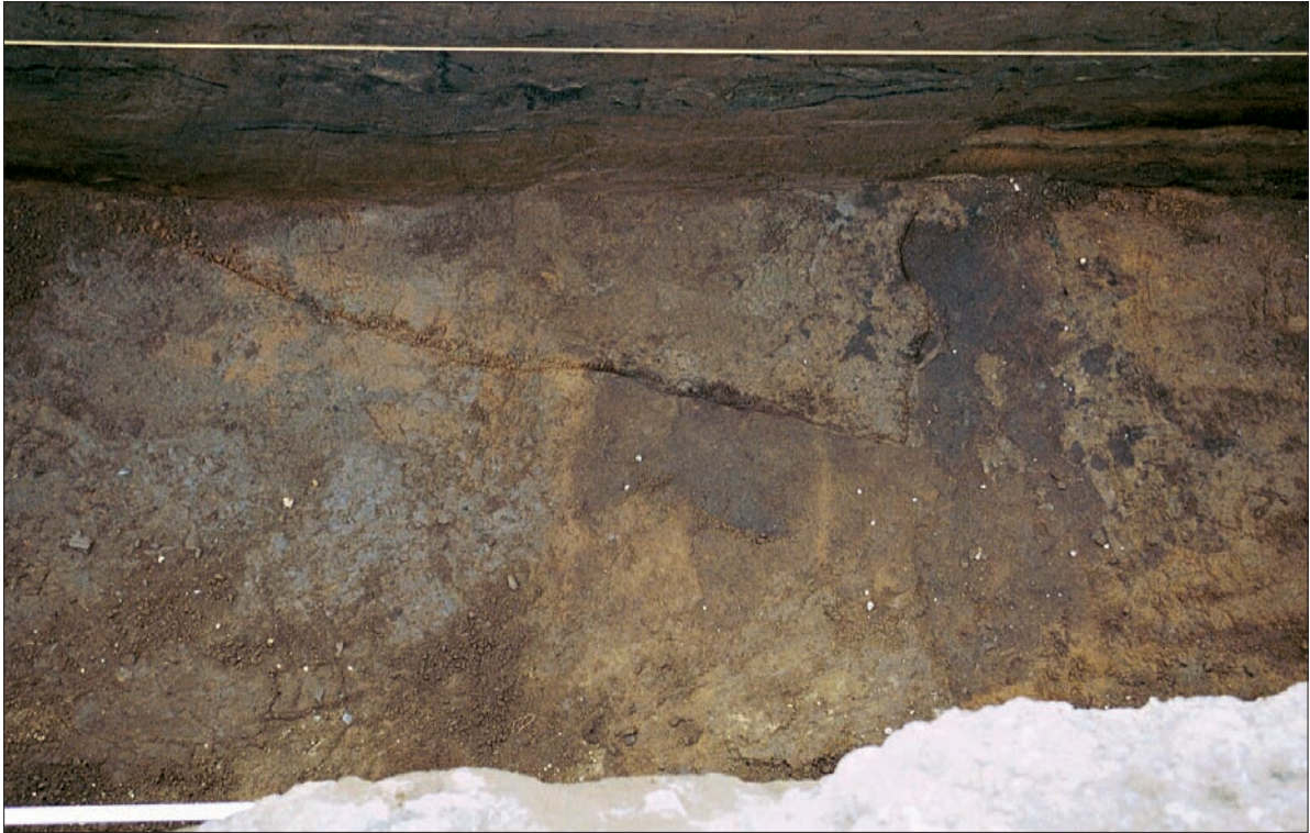
Gröf III. Neðsti hluti sem sýnir útlínur grafarinnar og hvar grafið er niður fyrir henni gegnum óhreyfð lög.