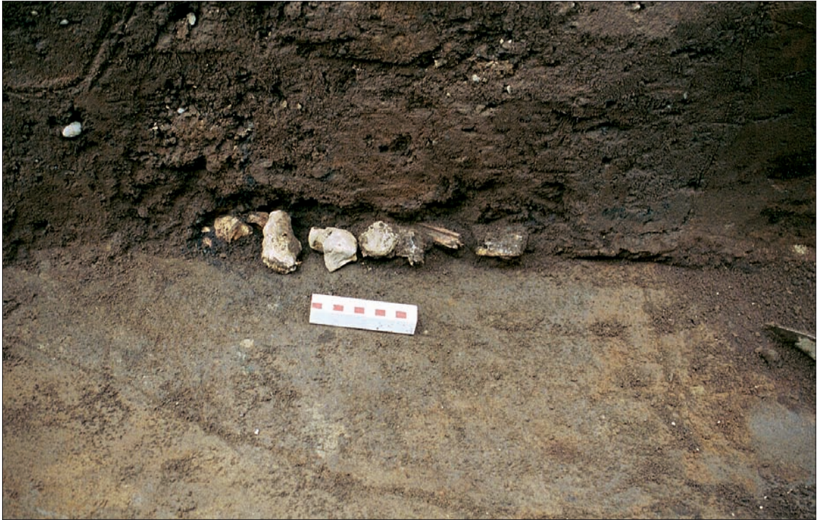
Gröf I. Vel sést móta fyrir útlínunum suðvesturhorns grafarinnar í skurðbotni. Ljós bein sem standa út úr skurðbakka á botni grafarinnar eru hluti af beingrind.