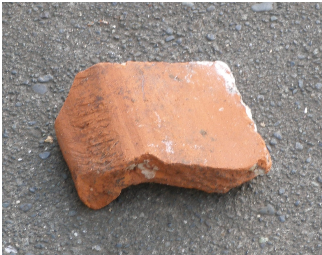
Mynd 5. Brot af þaksteini, um 8,5 cm langt. K.M.

Á milli steinanna í stéttinni fundust nokkrir munir, þar á meðal fjögur keramikbrot, rauður eða rauðbrúnn brenndur leir, sjá fundalista. Þrjú þessara brota vöktu athygli. 5,7 cm langur sívalningur úr rauðum brenndum leir. Sívalningurinn var brotinn í annan endann en á hinum endanum var eins konar hnúður. Hann var holur að innan. Tvö brot úr rauðbrenndum leir sem passa saman og mynda ytri og innri brún leirkers. Utan á leirkerinu hefur ekki verið glerungur en þar hafa verið skrautlínur og skrautbakkar. Að innan hefur kerid verið þakið með brúnum glerungi. Varla þarf að efast um að þessi þrjú brot eru úr sama kerinu og að það ker er eins og ker sem fannst í holu sem grafin var í gamla kirkjugarðinn austan við Nesstofu í apríl árið 2000. Þá fundust 7 leirkersbrot, öllu úr sama kerinu. Út frá brotunum var hægt að gera sér grein fyrir útliti kersins. Það var belglaga með 3 cm háum beinum hringlaga kantum efst. Þvermál opsins var 10 cm. Dýpt kersins var 8 cm. Það stóð á þremur fótum u.þ.b. 4 cm háum og heildarhæð þess var því um 12 cm. Aðeins fundust tveir fætur af þremur. Sívalt handfang með eins konar snúð á endanum var fest við kerid, 6 cm langt. Kerid var úr rauðum leir með brúnum glerungi að innan. Að utan var það skreytt með röndum sem gengu hringinn í kringum það. Guðrún Sveinbjarnardóttir fornleifafræðingur skoðaði kerid og taldi að það gæti verið frá 17. eða 18. öld.