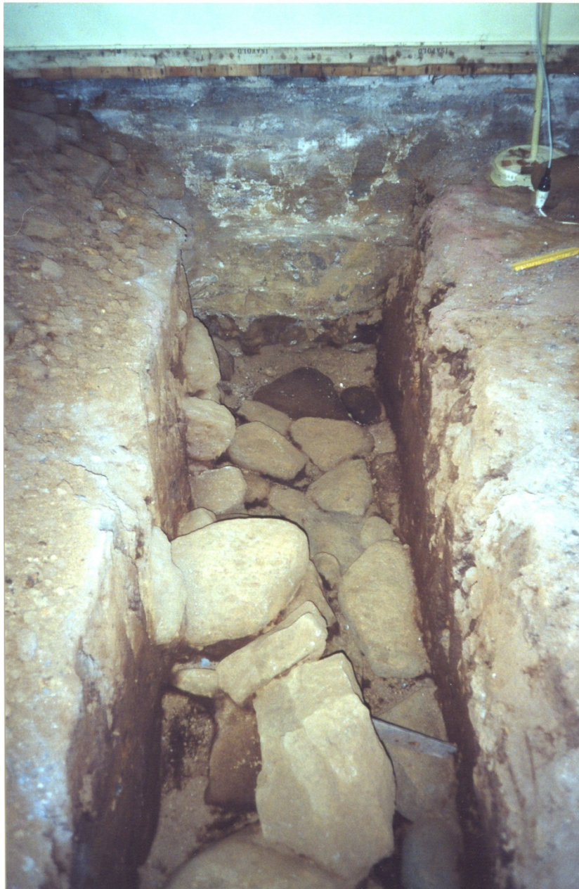
Mynd 8. Horft til norðurs eftir skurðinum. Grjótgarðurinn er fyrir miðju og stéttin sést hægra megin við hana. K.M.