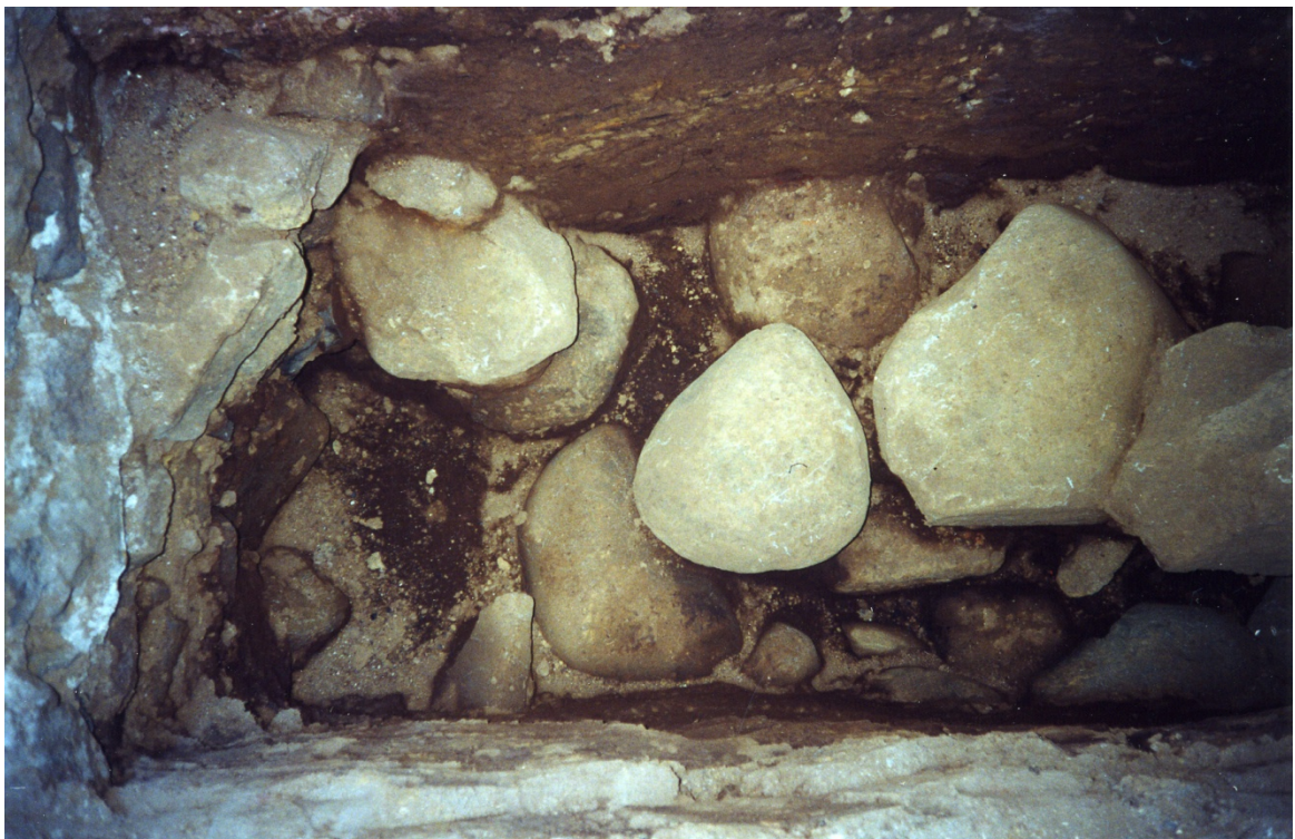
Mynd 7. Hleðsluleifar í suðurenda skurðar. K.M.