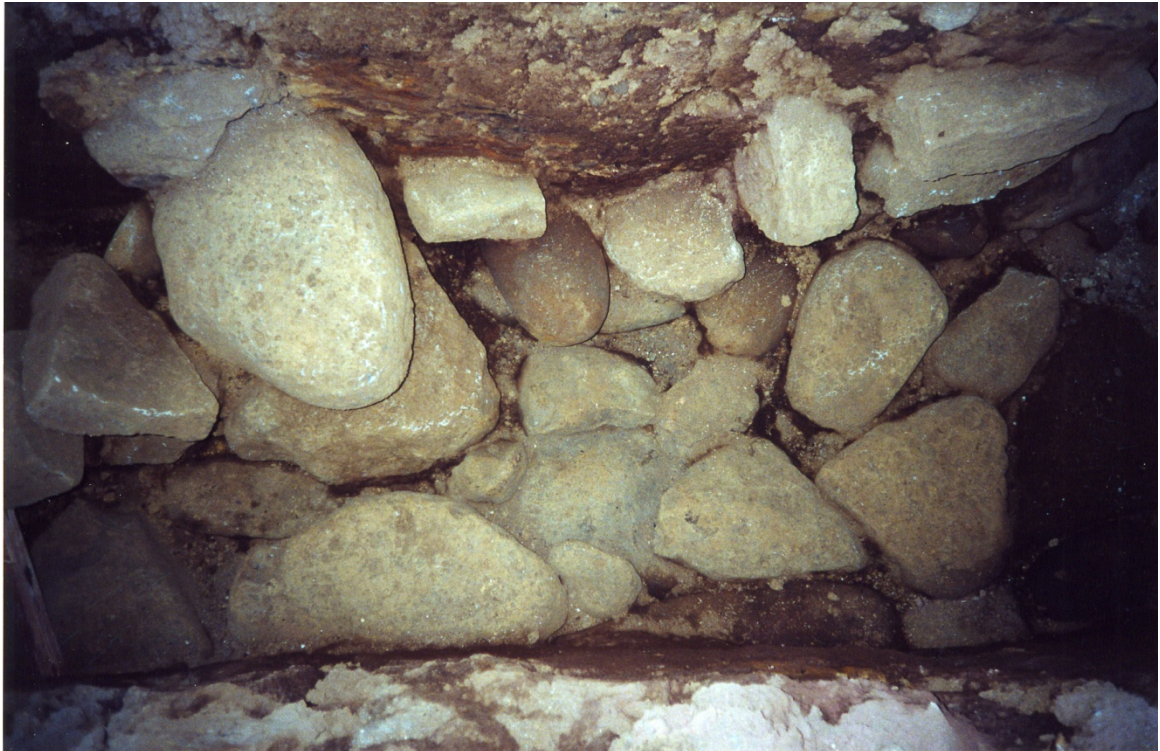
Mynd 6. Hleðsluleifar í skurði, norðan við miðju. K.M.