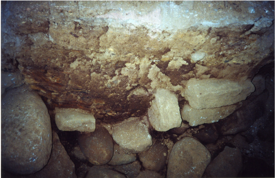
Mynd 3. Meint hlið í grjótgarði. K.M.