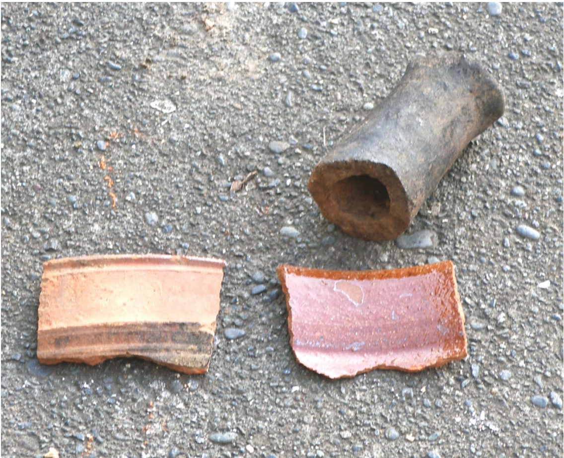
Mynd 4. Leirkersbrot fundin í stéttinni. Úr leirkeri á þremur fótum, sjá lýsingu í texta. K.M.