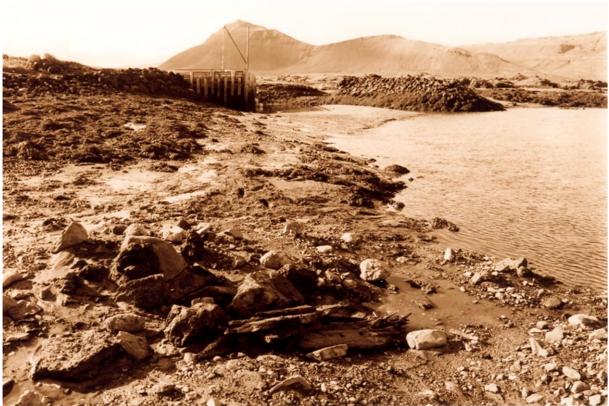
Mynd 1. Búðir (“flakið” er í sandfjöru neðan rafmagnsstaur)