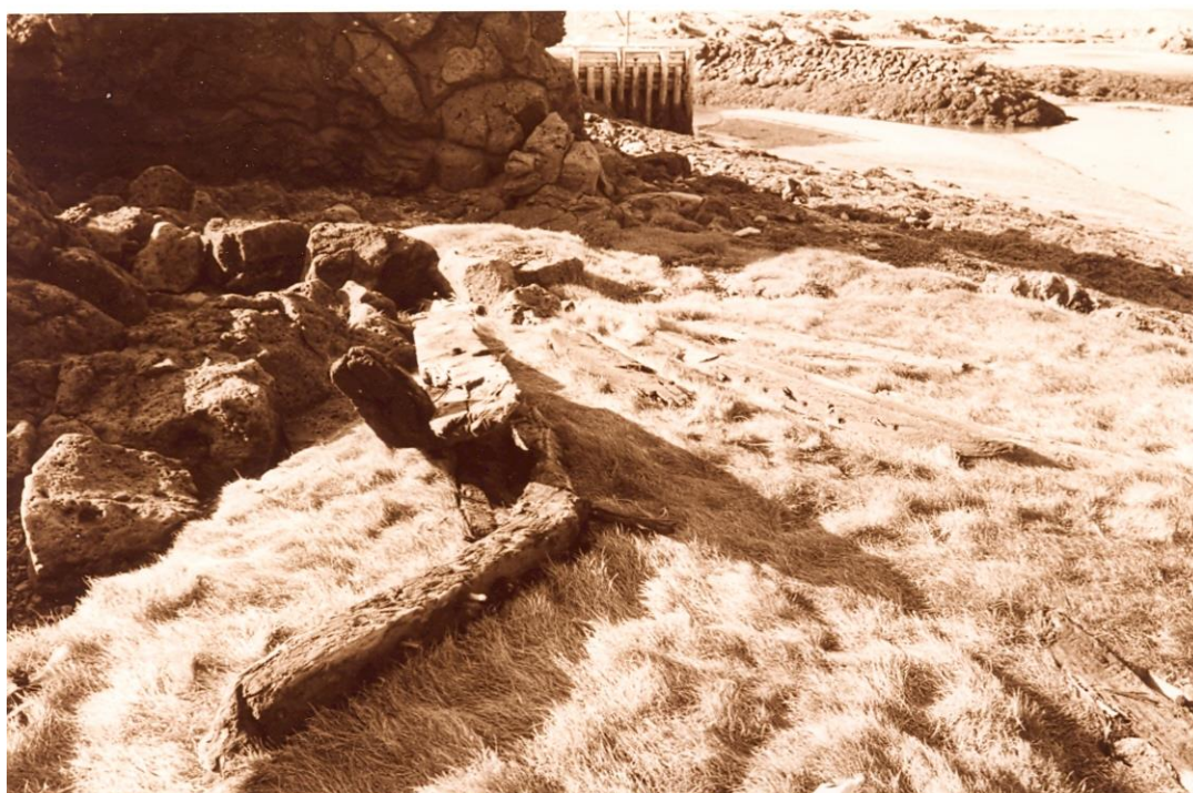
Mynd 2. Skipaviðir í fjörunni við Búðaás.

Í fjöruborðinu (á háfjöru) lá auk þess allstór grjóthrúga sem líklegast er úr kjölfestu skips ásamt talsverðu spýtnabraki, sem benti til að farið hefði verið ómjúkum höndum um skipsflakið þegar RARIK-menn grófu þarna. Vegna þess magns sem þarna var af viði og grjóti, auk múrsteinsbrota af ýmsu tagi, ákvað ég að taka aðeins sýnishorn, sem gætu gefið til kynna hversu gamalt og mögulega hvaðan þetta skip hefur verið. Þó verður að taka fram að vegna þess hvernig staðið var að “uppgreftri” þessum er erfitt að fullyrða að viðir og steinar úr kjölfestu eigi saman. Á stað sem Búðum, þar sem verslun hefur verið rekin um aldir, er líklegt að oft hafi kjölfestu og öðru verið fleygt í fjöruna.