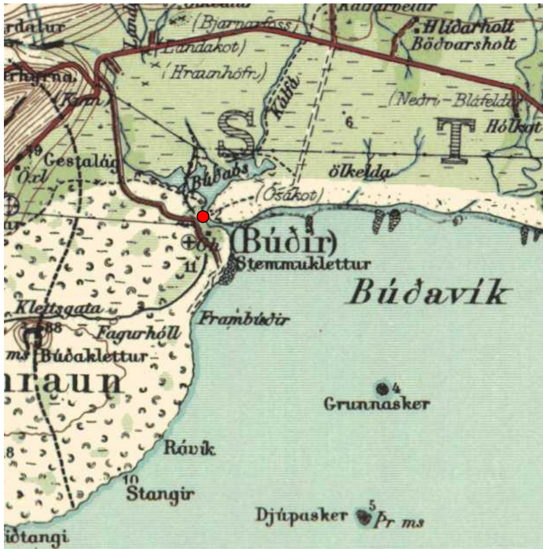
Mynd 3. Rauður hringur sýnir fundarstað á skipsviðum við Búðaós.